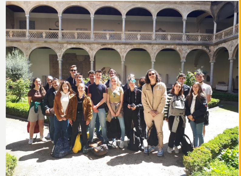
TOLEDE ET LE GRECO : VISITE DU MUSEE DE L'ARMEE, SYNAGOGUE ET DE L'EGLISE SAN TOME