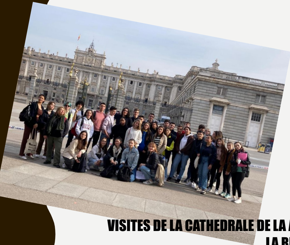
VISITES DE LA CATHEDRALE DE LA ALMUDENA, PRADO, RETIRO ET MUSEE DE LA REINA SOFIA