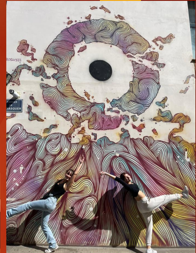
La alegría se transmite a través de las sonrisas