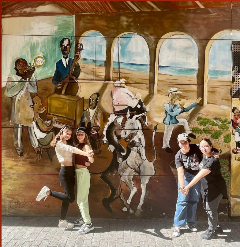
El baile de la calle