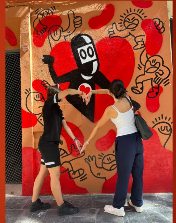
El rojo es la pasión