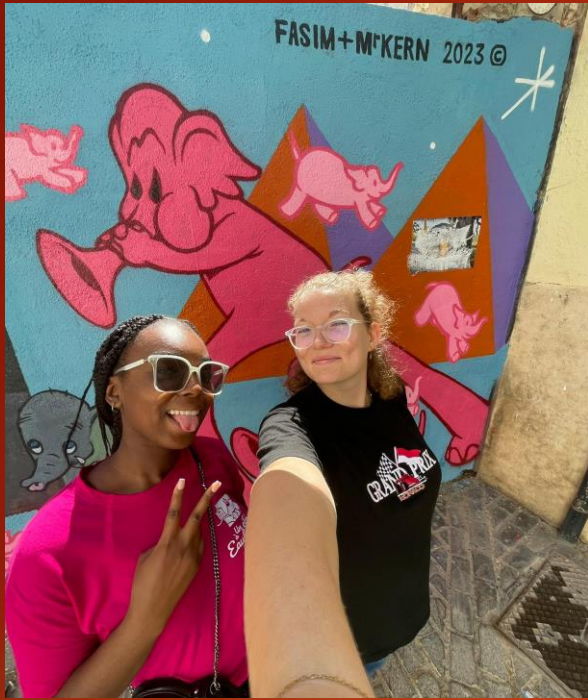
Un toque de rosa