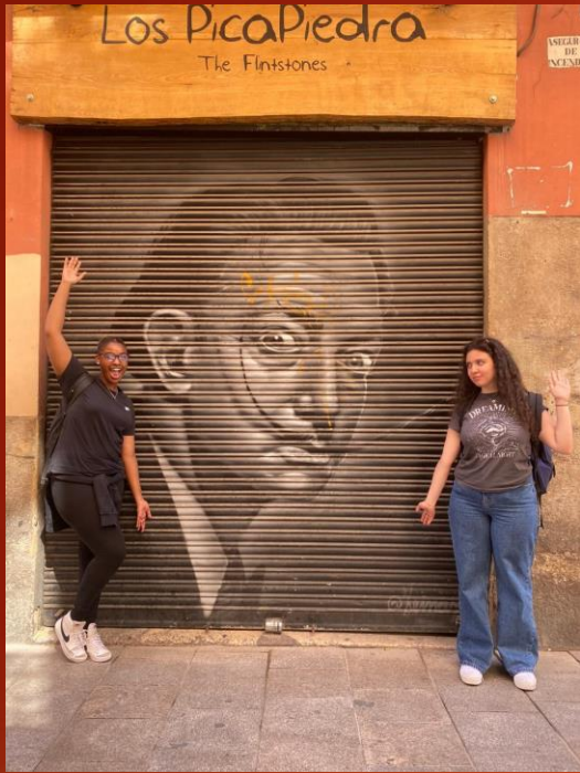
Asustado por el miedo